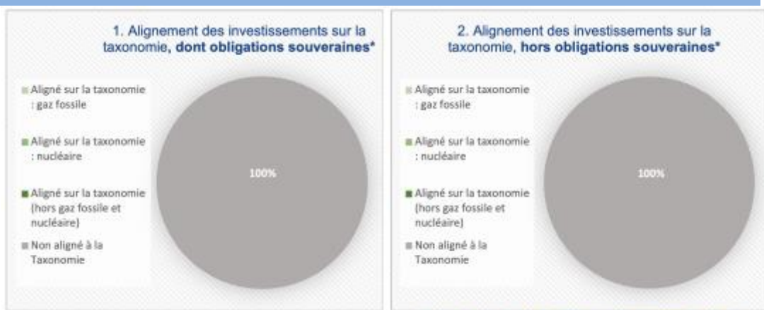
Ce graphique représente 100% du total des investissements.

Les deux graphiques ci-dessous font apparaître en vert le pourcentage minimal d'investissements alignés sur la taxonomie de l'UE. Étant donné qu'il n'existe pas de méthodologie appropriée pour déterminer l'alignement des obligations souveraines* sur la taxonomie, le premier graphique montre l'alignement sur la taxonomie par rapport à tous les investissements du produit financier, y compris les obligations souveraines, tandis que le deuxième graphique représente l'alignement sur la taxonomie uniquement par rapport aux investissements du produit financier autres que les obligations souveraines.